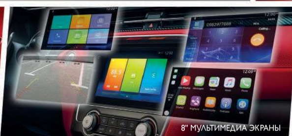
8" МУЛЬТИМЕДИА ЭКРАНЫ