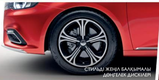
СТИЛЬДІ ЖЕҢІЛ БАЛҚЫМАЛЫ ДӨҢГЕЛЕК ДИСКІЛЕРІ