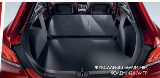
ЖҮКСАЛҒЫШ БӨЛІМІНІҢ КӨЛЕМІ 424 ЛИТР