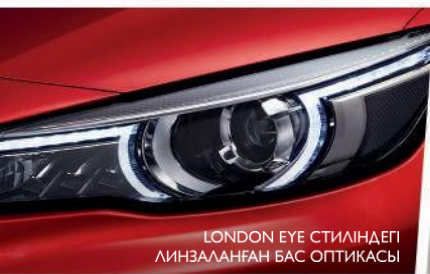
LONDON EYE СТИЛІНДЕГІ ЛИНЗАЛАНҒАН БАС ОПТИКАСЫ