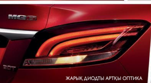
ЖАРЫҚ ДИОДТЫ АРТҚЫ ОПТИКА